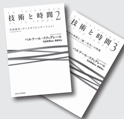
装幀: 岡田桃子・阿部卓也

ISBN978-4-588-12074-9 C3010 / 予価 5145 円 (本体 4900 円+税) レコードや映画産業などの文化産業は, メロディやイメージをつうじて人々の意識に働きかけ, それを市場化する。私たちが生きるのはポスト産業社会ではなく, ハイパー産業社会であると主張する。