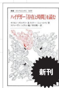
『ハイデガー「存在と時間」を読む』 サイモン・クリッチリーほか著 定価(本体4,000円+税)