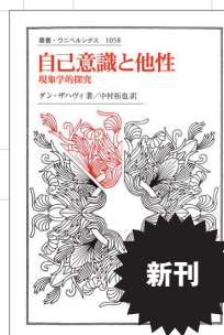
『自己意識と他性』 ダン・ザハヴィ 定価(本体4,700円+税)