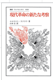
『現代革命の新たな考察』 エルネスト・ラクラウ 定価(本体4,200円+税)